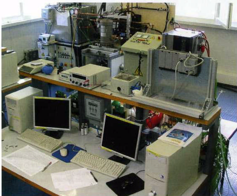
Verdichterprüfstand im TWK mit der Mess- und Auswertetechnik im Vordergrund