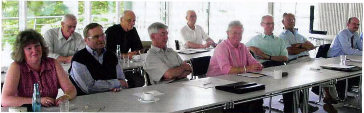
Die Teilnehmer der HKK-Versammlung diskutierten engagiert zu den bevorstehenden Aufgaben des Vereins