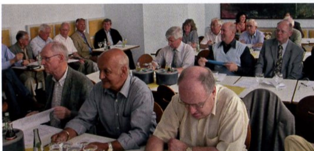
Optimismus beim HKK: Erfreulich viele Mitglieder kamen am 11. Mai 2006 zur Jahreshauptversammlung nach München