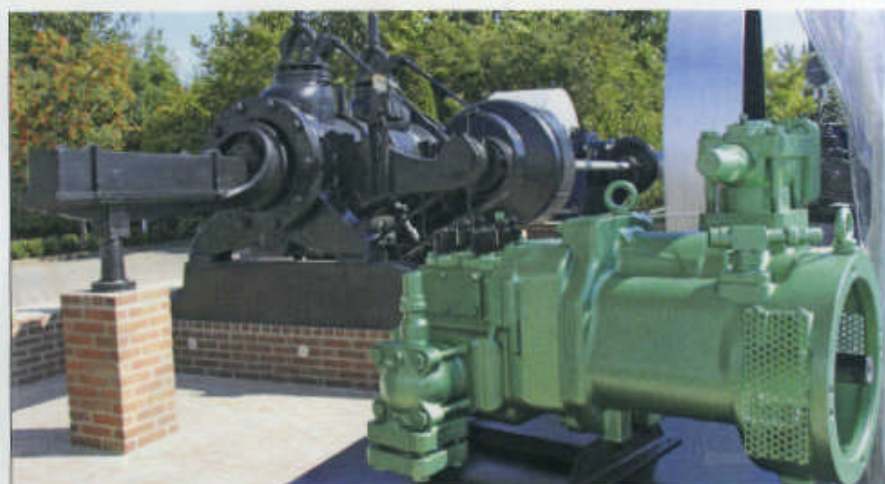
Der Germania-Verdichter von 1920 und der moderne Ammoniak-Verdichter von Bitzer im Vordergrund haben etwa die gleiche Leistung.

Inzwischen war die gesamte Maschine restauriert und wetterfest gemacht worden. Die Restauration führte die Firma Arnold aus Friedrichsdorf bei Frankfurt durch und sie leisteten eine hervorragende Arbeit. Dabei war sehr hilfreich, dass dort Mitarbeiter beauftragt wurden, denen die Aufarbeitung einer historischen Maschine auch eine Herzensangelegenheit war. Die Maschinenteile wurden zunächst zur Sichtung in einer Montagehalle