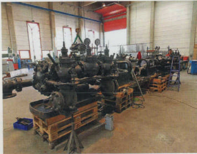
Aufwändige Restaurierung der einzelnen Bauteile

deutsche Lloyd und die Maatschappy Vianda gemeinsam entschieden, ein Hafenkühlhaus zu errichten, das in erster Linie als Speicher für überseeisches Gefrierfleisch zur Versorgung von Deutschland dienen sollte. Für die Ausführung des Plans stellte der Norddeutsche Lloyd ein günstiges Gelände zur Verfügung, das auf der durch Kai-