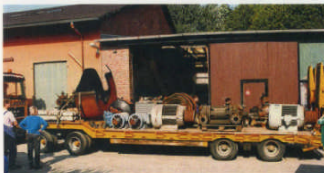
Abtransport auf Tieflader