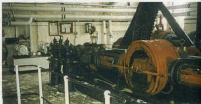
Die Kältemaschine vor dem Abbau im ehemaligen Kühlhaus